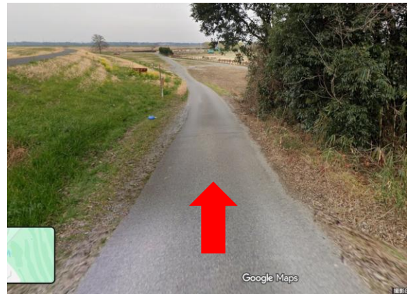
②矢印の方向へ進む。